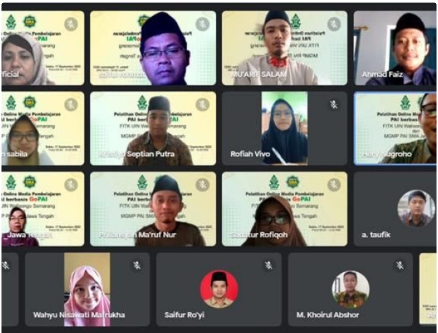
Musyawarah Guru Mata Pelajaran Pendidikan Agama Islam (MGMP PAI) SMA Propinsi Jawa Tengah, Menggelar Pelatihan media berbasis Go-PAI Secara Online. Kegiatan Ini Dilaksanakan Tanggal 17-24 September.

BANYUMAS- Musyawarah guru mata pelajaran pendidikan agama islam (MGMP PAI) SMA Propinsi Jawa Tengah, menggelar pelatihan media berbasis Go-PAI